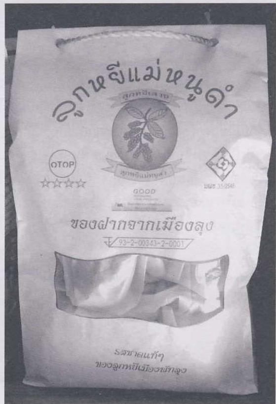
ผลิตภัณฑ์ลูกหิยกวนที่มีบรรจุภัณฑ์สวยงาม