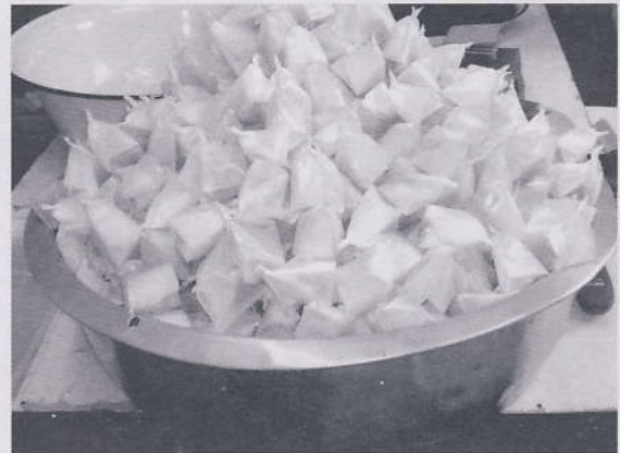
ลูกหิยกวนก่อนบรรจุลงในบรรจุภัณฑ์

ทำบาร์คู บาร์เตี้ยว บันไดโต ไม้เท้าและด้ามร่ม ได้อีกด้วย ไม้หิยถือว่าเป็นไม้ที่มีราคาแพง ที่ซื้อขายกันอยู่ขนาดเส้นผ่าศูนย์กลางของลำต้น 1 เมตร ยาว 4 เมตร ราคาอยู่ระหว่าง 5,000 ถึง 10,000 บาท จึงเห็นได้ว่าหิยเป็นไม้ป่าที่แทบจะไม่มีการลงทุนเลย แต่สร้างรายได้เสริมให้กับผู้เกี่ยวข้องได้ แม้ว่ามูลค่าต่อไปจะไม่สูงเหมือนไม้เศรษฐกิจอื่น ๆ ก็ตาม