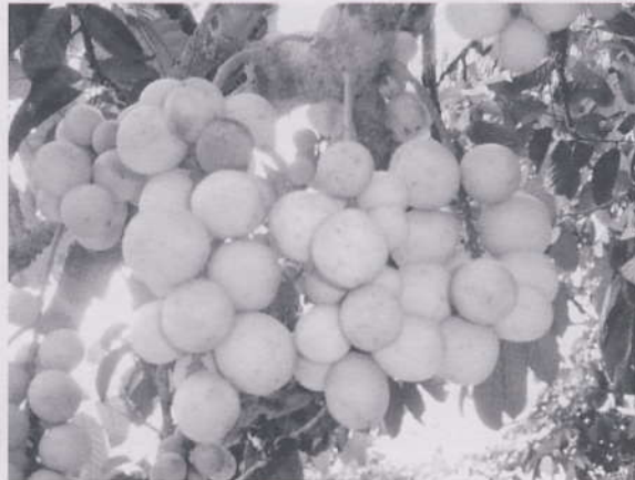
ไม่ตัดแต่งช่อผล

การจะผลิตลองกองให้ได้คุณภาพเกรดเอนั้น ต้องเริ่มลงมือปฏิบัติตั้งแต่การตัดแต่งช่อดอก หลังจากนั้น จึงทำการตัดแต่งช่อผลและผลิตผลที่ไม่มีคุณภาพทิ้งไป เพราะปริมาณช่อดอกและช่อผลที่มากเกินไปจะมีผลกระทบต่อพัฒนาการของผล ทำให้ผลเจริญเติบโตช้าและมีขนาดเล็ก ผลร่วงในปริมาณมากเนื่องจากการแข่งขันระหว่างผลอ่อนในช่อเดียวกันและต่างช่อกันอย่างรุนแรงในการดูดดึงอาหารสะสมไปใช้ในการพัฒนาการของผล ดังนั้น ในระหว่างเดือนพฤษภาคม ถึง มิถุนายนซึ่งเป็นระยะพัฒนาผล กลุ่มวิชาการ สำนักวิจัยและพัฒนาการเกษตรเขตที่ 8 จ.สงขลา จึงมีคำแนะนำหรือข้อปฏิบัติให้เกษตรกรชาวสวนลองกองตัดแต่งช่อและผลิตผล ดังต่อไปนี้