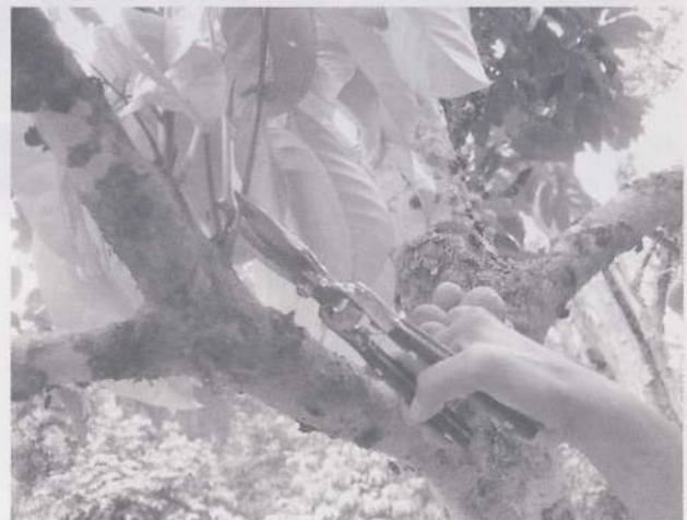
ตัดกิ่งกระโดงที่แตกออก

การป้องกันกำจัดโรดแมลง ในช่วงเตรียมความพร้อมต้นมักพบการเข้าทำลายของโรคราสีขาว โรคราสีชมพู และหนอนกินใต้ผิวเปลือกเสมอ ซึ่งจะทำให้ใบและกิ่งแห้ง วิธีการป้องกันให้ตัดกิ่งทิ้งและเผาทำลาย แต่ถ้าอาการรุนแรงมากให้พ่นสารเคมีชนิดคอปเปอร์ออกไซด์ไฮดรอกไซด์หรือแมนโคเซบ และพ่นไล่เดือนฝอย ตามอัตราที่แนะนำ