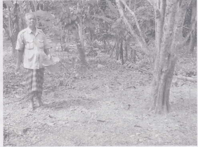
ใส่ปุ๋ยคอกควบคู่กับปุ๋ยเคมี