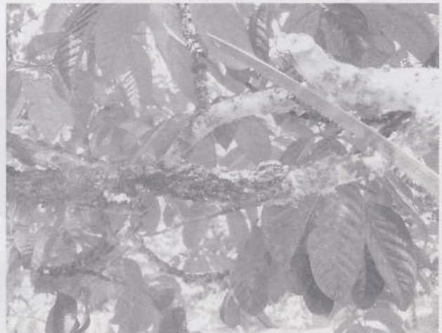
เลือกกิ่งแห้ง กิ่งแขนง กิ่งเป็นโรคทิ้ง

อนึ่ง เพื่อให้การใส่ปุ๋ยเป็นไปอย่างมีประสิทธิภาพ ควรเก็บตัวอย่างดินไปวิเคราะห์ จะช่วยทำให้ทราบสถานะความอุดมสมบูรณ์ของดินว่ามีมากน้อยเพียงใด รายละเอียดเกี่ยวกับวิธีการเก็บตัวอย่างดิน การส่งตัวอย่างดินไปวิเคราะห์สามารถติดต่อสอบถามได้ที่ กลุ่มพัฒนาการตรวจสอบพืชและปัจจัยการผลิต สวพ.8 โทร. 0-7444-905-6