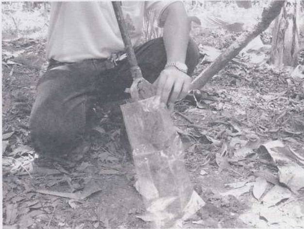
เก็บตัวอย่างดินไปวิเคราะห์ก่อนใส่ปุ๋ย