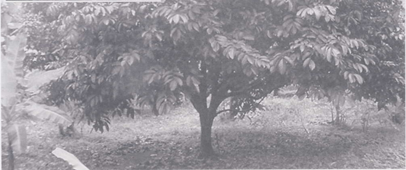
สภาพต้นและใบที่สมบูรณ์