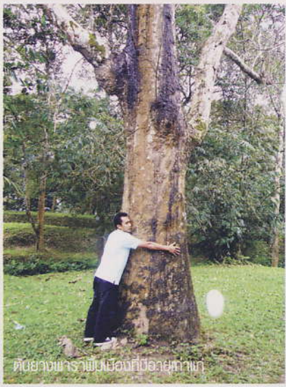
ต้นยางพาราพุ่มเมืองที่ช่วยถ้ำพญา