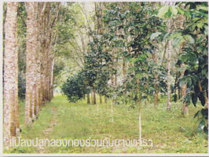
แปลงปลูกของทองรวมถันยางพารา