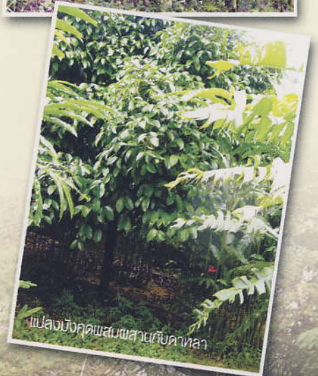
แปลงบึงกุดผสมผสานกับคันทาล

บรรยากาศอันรื่นรมย์ เย็นสบาย บนพื้นที่กว่า 1,000 ไร่