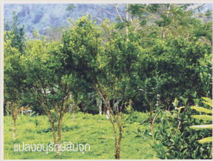
แปลงอนุรักษ์ลิ้นจี่