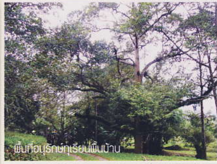
พื้นที่อนุรักษ์ทุเรียนพื้นบ้าน