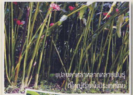
แปลงคันทาลหลากหลายพันธุ์ ที่ใหญ่ที่สุดในประเทศไทย