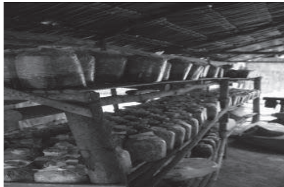
การบ่มก้อนเห็ดในโรงบ่ม