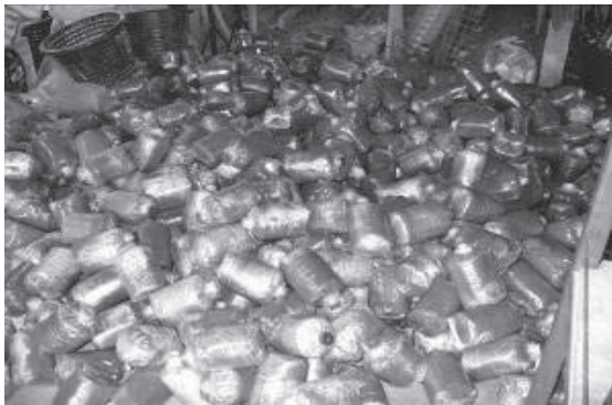
วัสดุเพาะเห็ดที่บรรจุลงในถุงพลาสติก