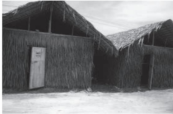
โรงเปิดดอก