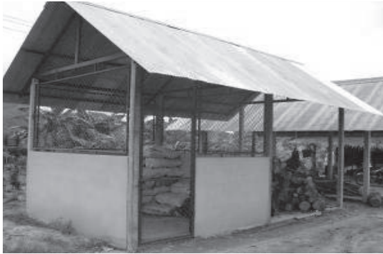
โรงเก็บวัสดุการเกษตร ขนาด ๓x๖ เมตร

โครงการฟาร์มตัวอย่างตามพระราชดำริ วังพญา-ท่าธง อำเภอรามัน จังหวัดยะลา