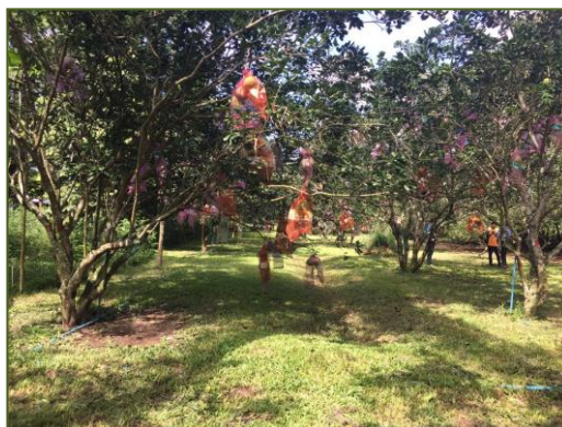
ภาพผนวกที่ 1 สวนส้มโอที่มีการจัดการสวนดี ตัดแต่งกิ่ง ห่อผล ไม่พบการระบาดของโรคและแมลง