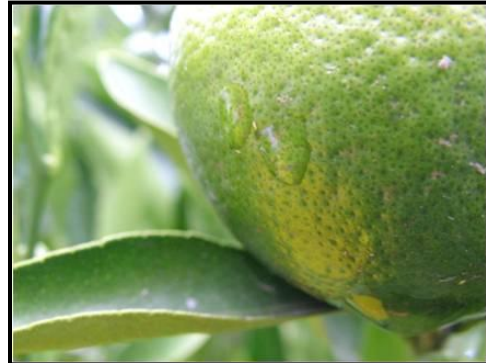
ภาพที่ 4 ลักษณะการเข้าทำลายของเพลี้ยไฟ