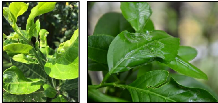
ภาพที่ 1 ลักษณะการเข้าทำลายของหนอนซอนใบส้ม

1.3 อิมิดาโคลพริด (imidacloprid) เช่น คลอพิดอร์ 10% SL อัตรา 8 มิลลิลิตร ต่อน้ำ 20 ลิตร ผสมสารจับใบพ่นให้ทั่วทั้งด้านหน้าใบและหลังใบ ถ้ายังสำรวจพบการระบาดของหนอนซอนใบส้มให้พ่นซ้ำ